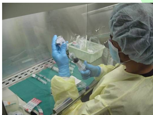
● 薬局 ●