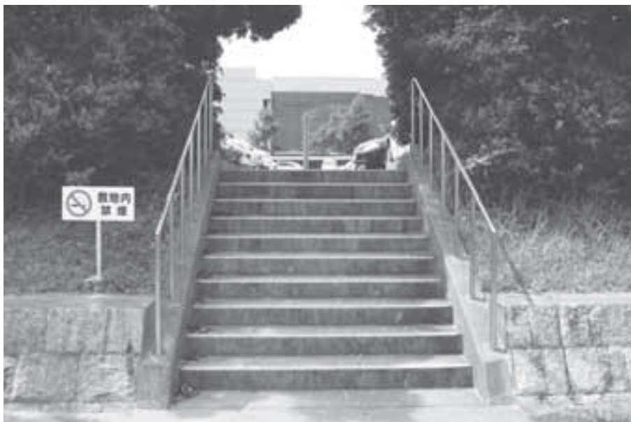
津波等の浸水対策として 地面を高くしています