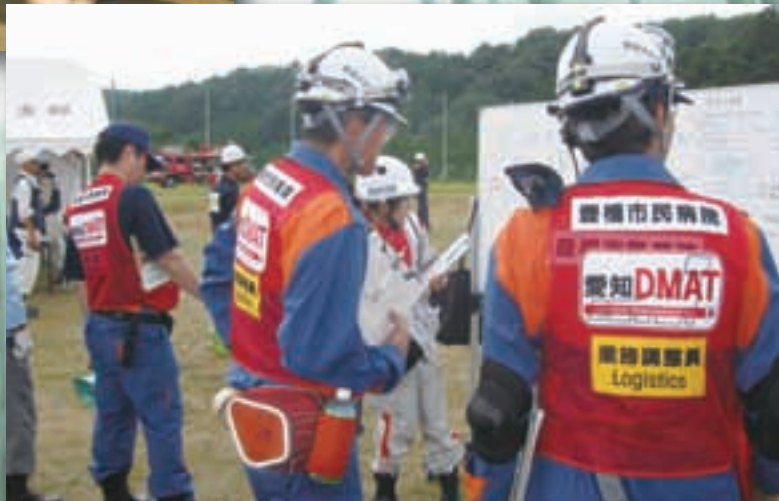
新城市総合防災訓練