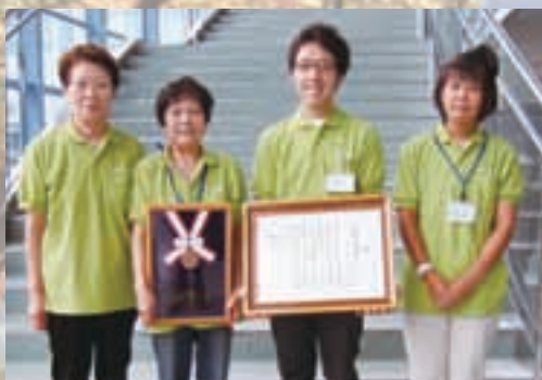
メンバーを代表して表彰式に参加しました

患者さんの車椅子乗り降りや外来受診の受付介助などのサポート活動を行っているボランティアグループ「ブルーバンブー」が、平成23年8月21日に開催された豊橋市社会福祉大会において、「社会福祉銅有功章」を受賞しました。