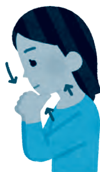
⑥あご持ち上げ体操