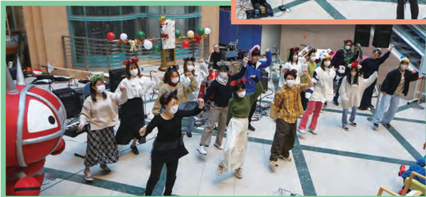
院内クリスマスコンサートのようす